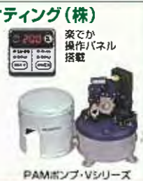
PAMポンプ・Vシリーズ