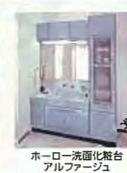
ホーロー洗面化粧台 アルファージュ