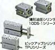
薄形油圧シリンダ 10DS-1シリーズ ピックアップシリンダ TPUシリーズ