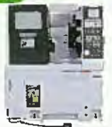
8" チャック対応CNC旋盤 TCC-200G