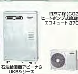
自然冷媒(CO2) ヒートポンプ式給湯機 エコキュート 370L