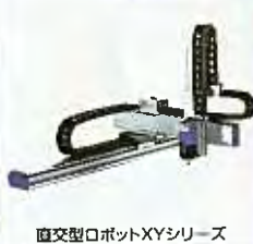
直交型ロボットXYシリーズ