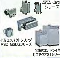
空圧バルブ 4GA-4GB シリーズ 小形コンパクトシリンダ MSD-MSDGシリーズ 冷凍式エアドライヤ ゼD7A7AGTシリーズ