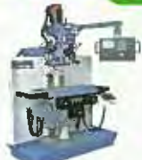
コントロール付ニータイプ フライス盤 ST-NR20