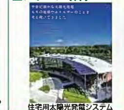
住宅用太陽光発電システム