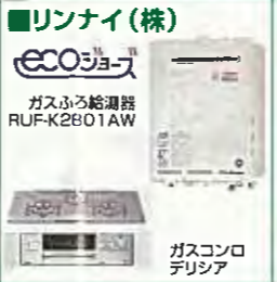
ガスコンロ デリシア