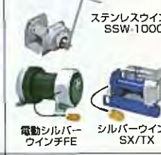
ステンレスウィンチ SSW-1000 電動シルバー ウィンチFE シルバーウィンチ SX/1X