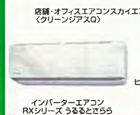
店舗・オフィスエアコンスカイア (クリーンシアSQ)