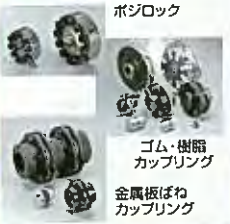
ボジロック ゴム・樹脂 カップリング 金属板ばね カップリング