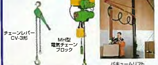
チェーンレバー CV-3形 MH型 電気チェーン ブロック バキュームリフト