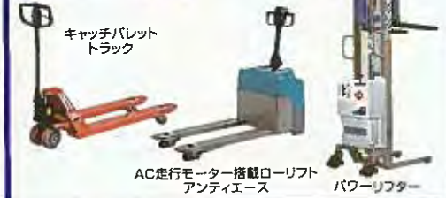
キャッチパレット トラック AC走行モーター搭載ローリフト アンティエース パワーリフター