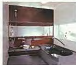
アクリア・バス 1625A型SBシリーズ