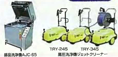
部品洗浄機AJC-65 TRY-245 TRY-345 高圧洗浄機ジェットクリーナー