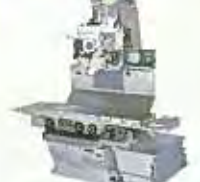
スーパーミルシリーズ 立中ぐりフライス盤YZ-8WR