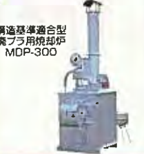
構造基準適合型 炭プラ用焼却炉 MDP-300