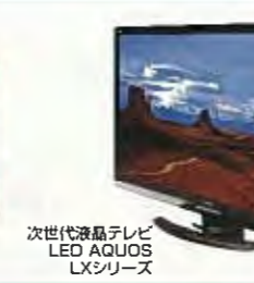
次世代液晶テレビ LED AQUOS LXシリーズ