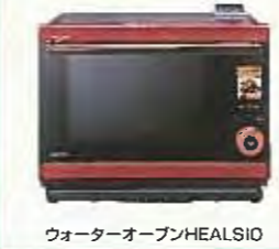
ウォーターオープンHEALSIO