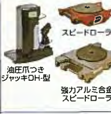
スピードローラー 油圧爪つき ジャッキDH-型 強力アルミ合金製 スピードローラー