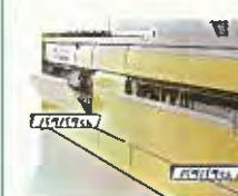
ドアポケット「バタバタくん」