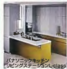
パナソニックキッチン リビングステーションL-class