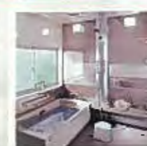
調物ホーロー浴槽システムバス プレデシア