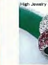
High Jewelry & Bridal BLOOM