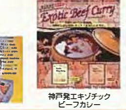
神戸発エキゾチック ビーフカレー