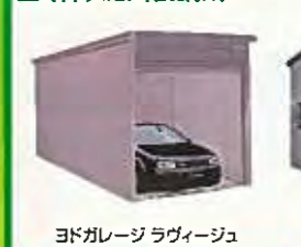
ヨドガレージラヴィージュ