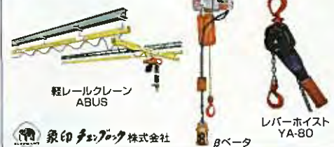
軽レールクレーン ABUS レバーホスト YA-80 Bベータ