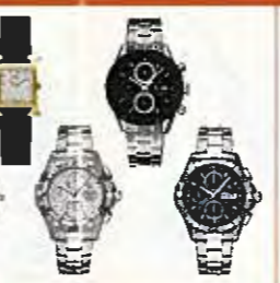
ブランドウォッチ各種