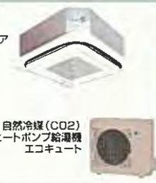
自然冷媒(CO2) ヒートポンプ給湯機 エコキュート