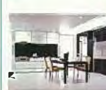
システムキッチン サンヴァリエ(ビット)