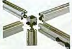
アルミニウム製ストラットプロファイル