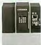
立形マシニングセンタ DuraVertical 5060