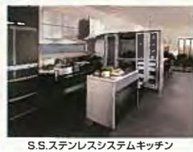
S.S.ステンレスシステムキッチン