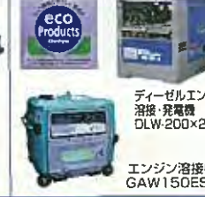
ディーゼルエンジン 溶接・発電機 DLW-200x2LS エンジン溶接機 GAW150ES2