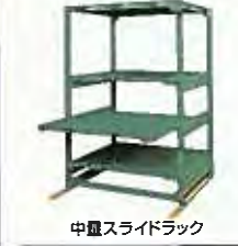
中置スライドラック