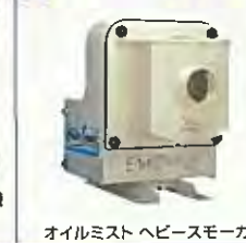
オイルミストヘビースモーカー