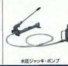
水圧ジャッキ・ポンプ