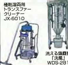
横乾湿両用 トランスファー クリーナー JX-6D10 洗える集塵機 「洗風」 WDS-281