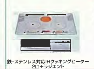
鉄・ステンレス対応IHクッキングヒーター 2口+ラジエント