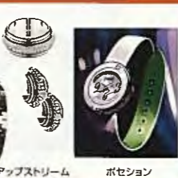
アップストリーム