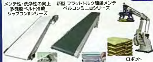
メンテナンス・洗浄性の向上 多機能ベルト搭載 ジャブコンシリーズ