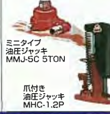
ミニタイプ 油圧ジャッキ MMJ-5C 5TON 爪付き 油圧ジャッキ MHC-1.2P