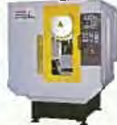
高速万能AI CNCドリル ROBODRILLα-T14Fa