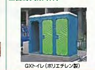
GXトイレ(ポリエチレン製)