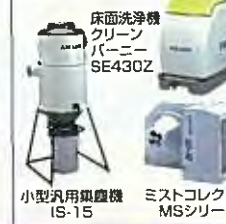
床面洗浄機 クリーン パーニー SE430Z 小型汎用集塵機 IS-15 ミストコレクター MSシリーズ