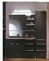
アクリステンカウンター 洗面化粧台 ティアリス