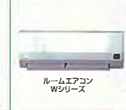
ルームエアコン Wシリーズ