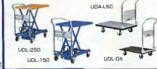
ユニバーサルデザインシリーズ UDA-LSC UDL-250 UDL-150 UOL-DX