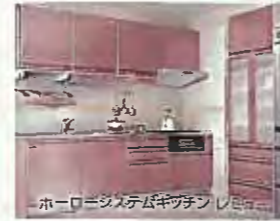
ホーローシステムキッチン レモネ