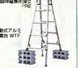
移動式アルミ 作業台 WTF