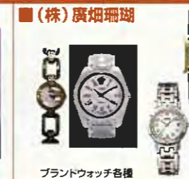
ブランドウォッチ各種