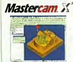
Mastercam X 3