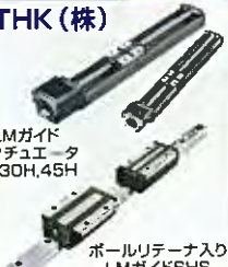
LMガイド アクチュエータ KR30H,45H ボールリテーナ入り LMガイドSHS