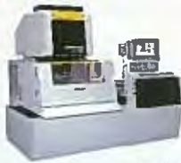
高速・高精度AIワイヤカット 放電加工機ROBOCUTα-D/D