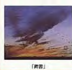
自然塗装仕上げ 壁